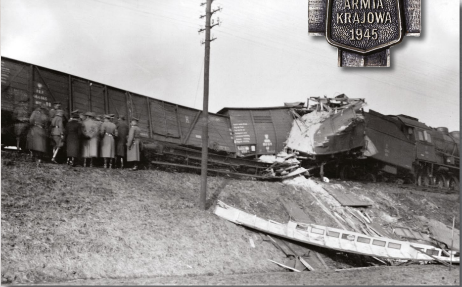
Wykolejony przez żołnierzy polskiej konspiracji pociąg relacji Ostrów–Kępno, marzec 1940 r. Ze zbiorów IPN