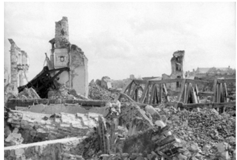
Ruiny Zamku Królewskiego w 1945 r.