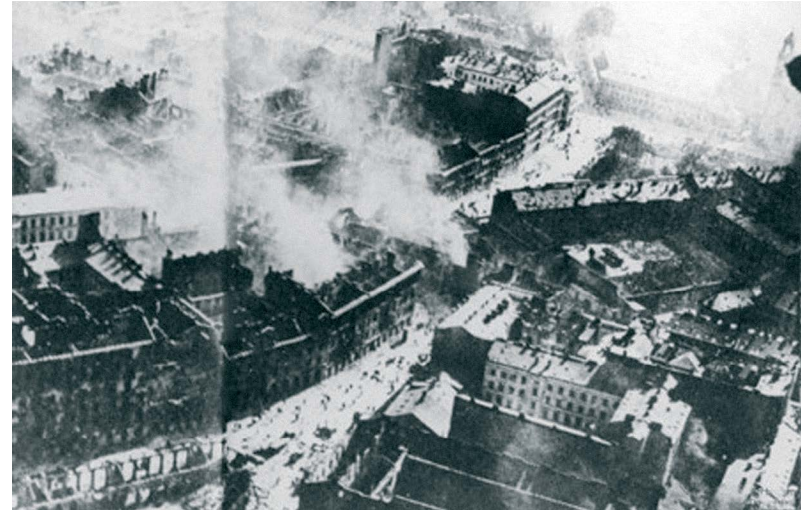
Płonąca po nalocie bombowym Warszawa 24.09.1939 r.