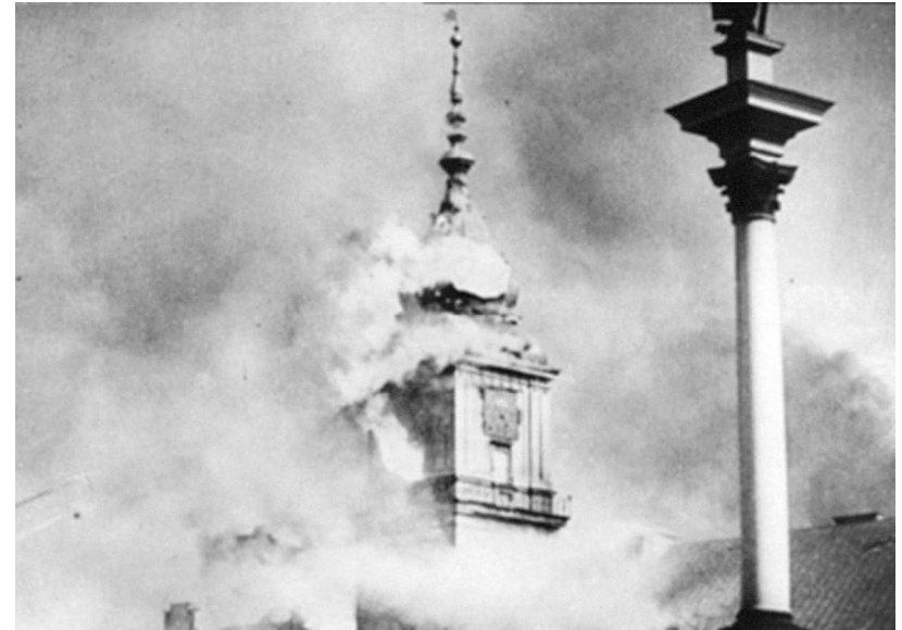
Pożar Zamku Królewskiego 11 września 1939 r.