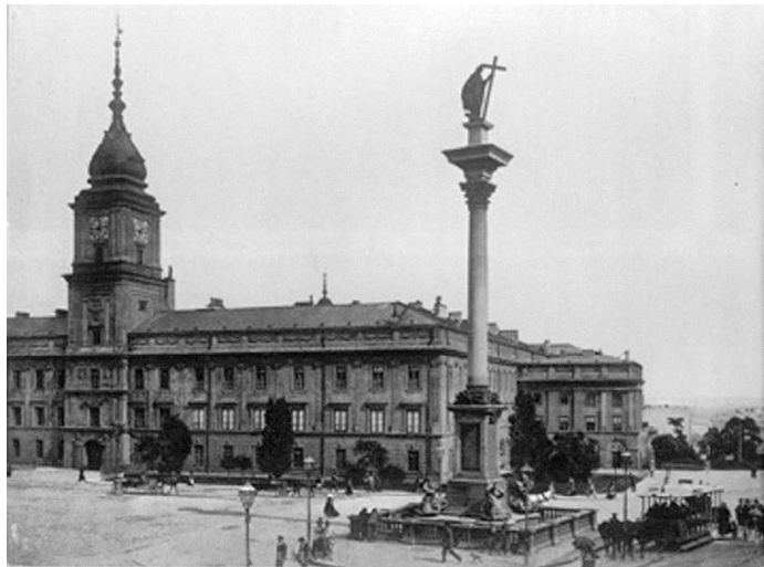
Zamek Królewski przed wybuchem II Wojny Światowej

Dokonaj analizy zamieszczonych źródeł ikonograficznych i odpowiedz na pytanie.